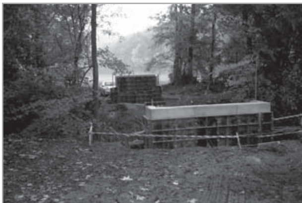
cyklostezka Velehrad - Salaš: základy mostu přes Salašku