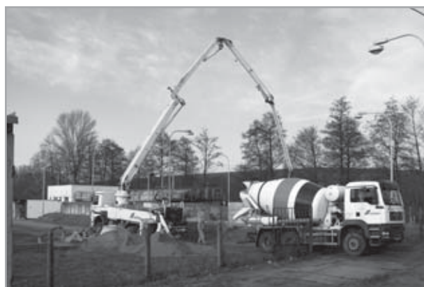
zahájení rekonstrukce ČOV