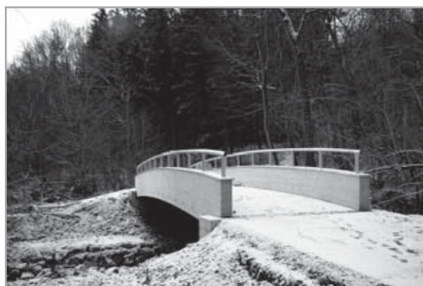
cyklostezka Velehrad - Salaš: most přes Salašku