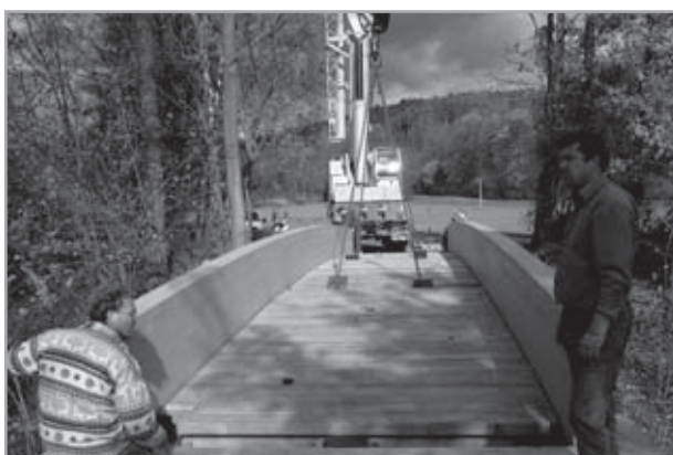
cyklostezka Velehrad - Salaš: umístění mostu