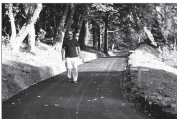
cyklostezka Velehrad - Salaš: od autokempu