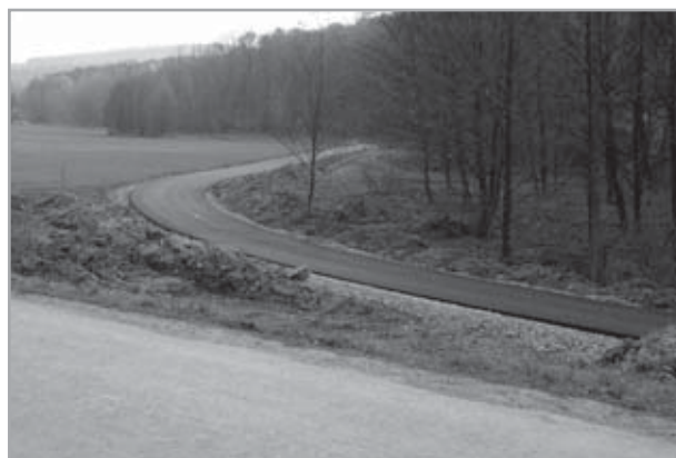
cyklostezka Velehrad - Salaš