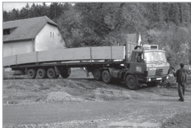
cyklostezka Velehrad - Salaš: doprava mostu na místo