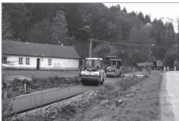
cyklostezka Velehrad - Salaš: vyústění na Salaši