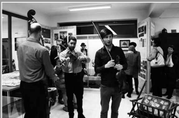
Výstava „U nás na Velehradě“

Na Vaši návštěvu se těší pracovníci Turistického centra Velehrad.