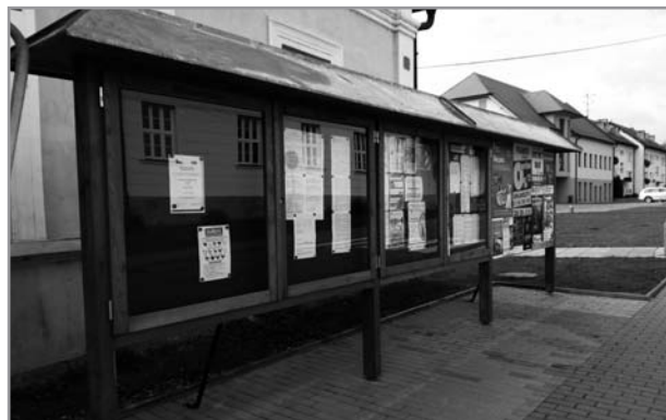
Nové vývěsní skříňky