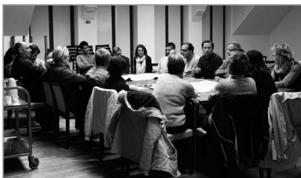
Projednání záměru parku kolem turistického centra