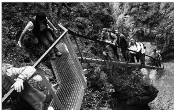
Výlet do Terchové - Jánošíkovy díry