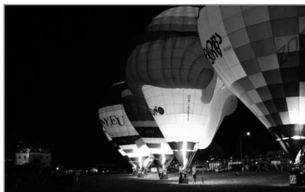
Balóny na Velehradě