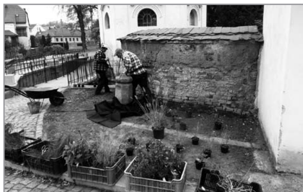
Výsadba zeleně u mostu