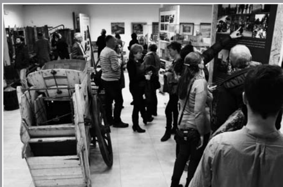
Výstava „U nás na Velehradě“