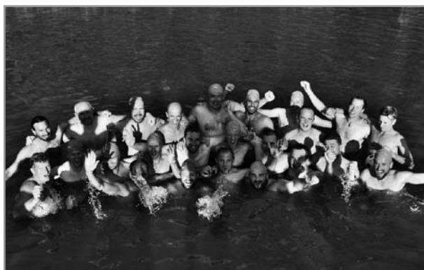
Zápas ve vodním pólu Velehrad vs. Modrá