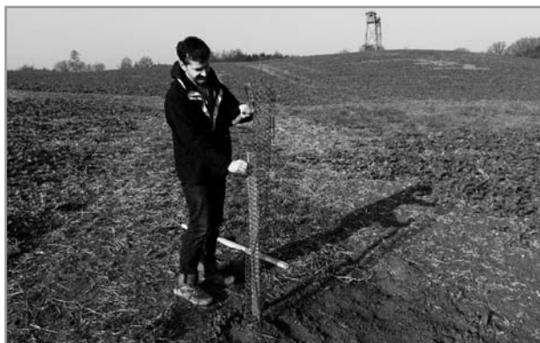
Výsadba stromů v mezích nad Hájem

Vyšlo 22. prosince 2016, náklad 450 výtisků.