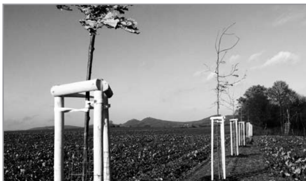
Větrolam nad hájem