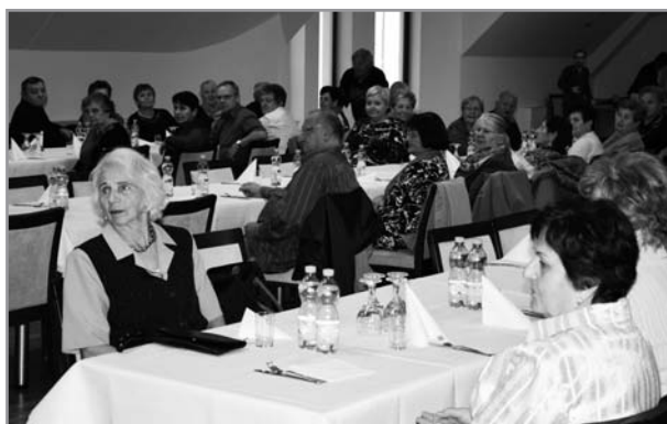
Beseda s důchodci