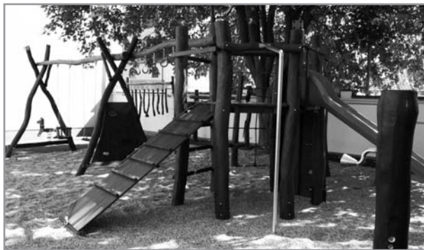
Nové hřiště v Mateřské školce