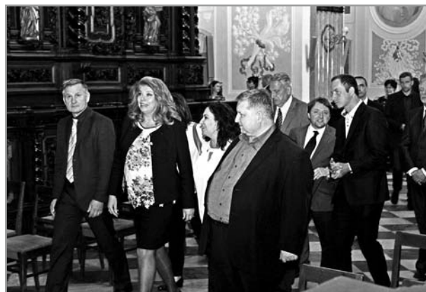
Návštěva víceprezidentky Bulharska