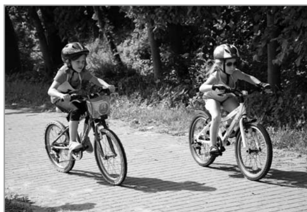
Cyklopřejezd - Chřiby 2018