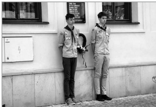
Uctění památky padlých při výročí osvobození obce Velehrad