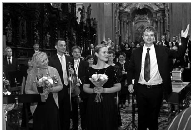
Slavnostní koncert - výročí republiky a baziliky