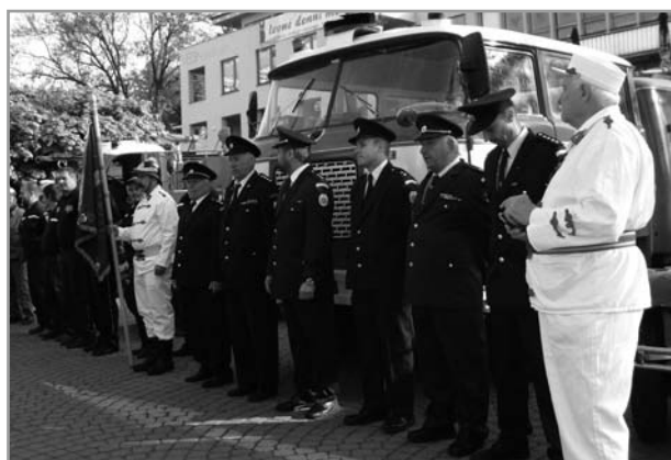
Historický jízda hasičů