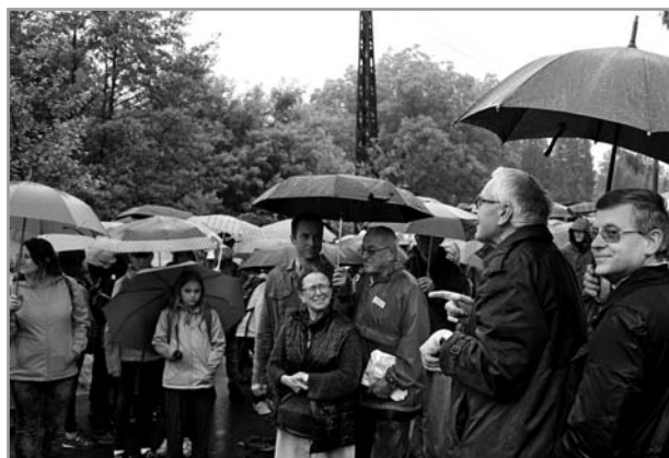
Návštěva francouzských poutníků