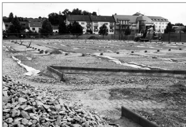
Výstavba víceúčelového hřiště