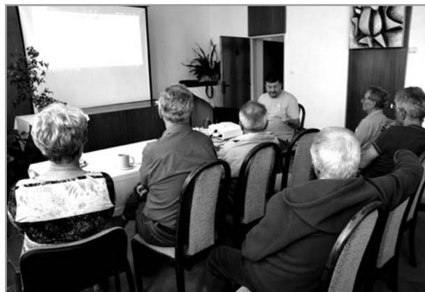
Beseda o novinkách pro řidiče na obecním úřadě