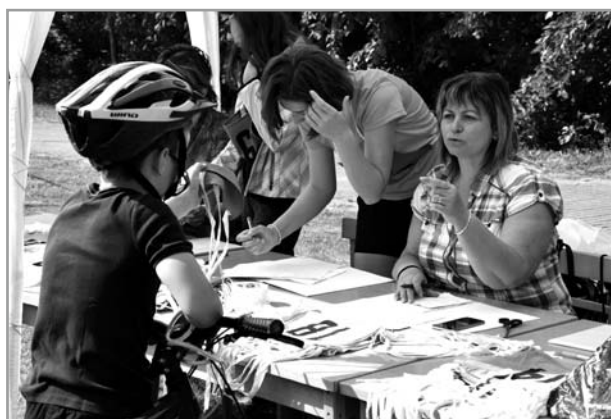
Cyklopřejezd - Chřiby 2018