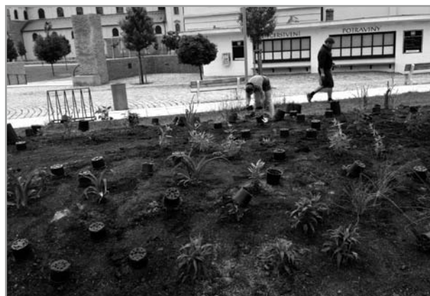
Výsadba zeleně ve středu obce