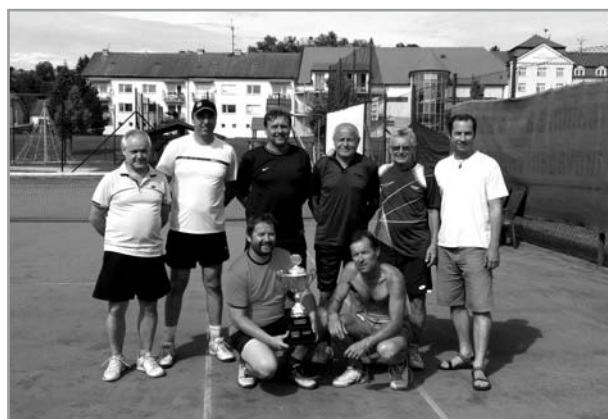
Tenisový turnaj „O pohár starosty“