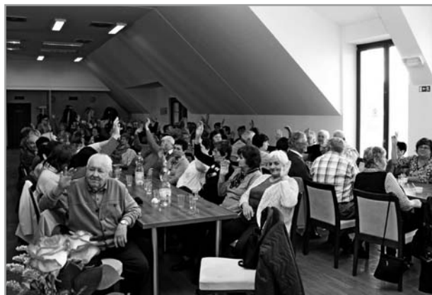
Výroční schůze SPCCH a STP Velehrad