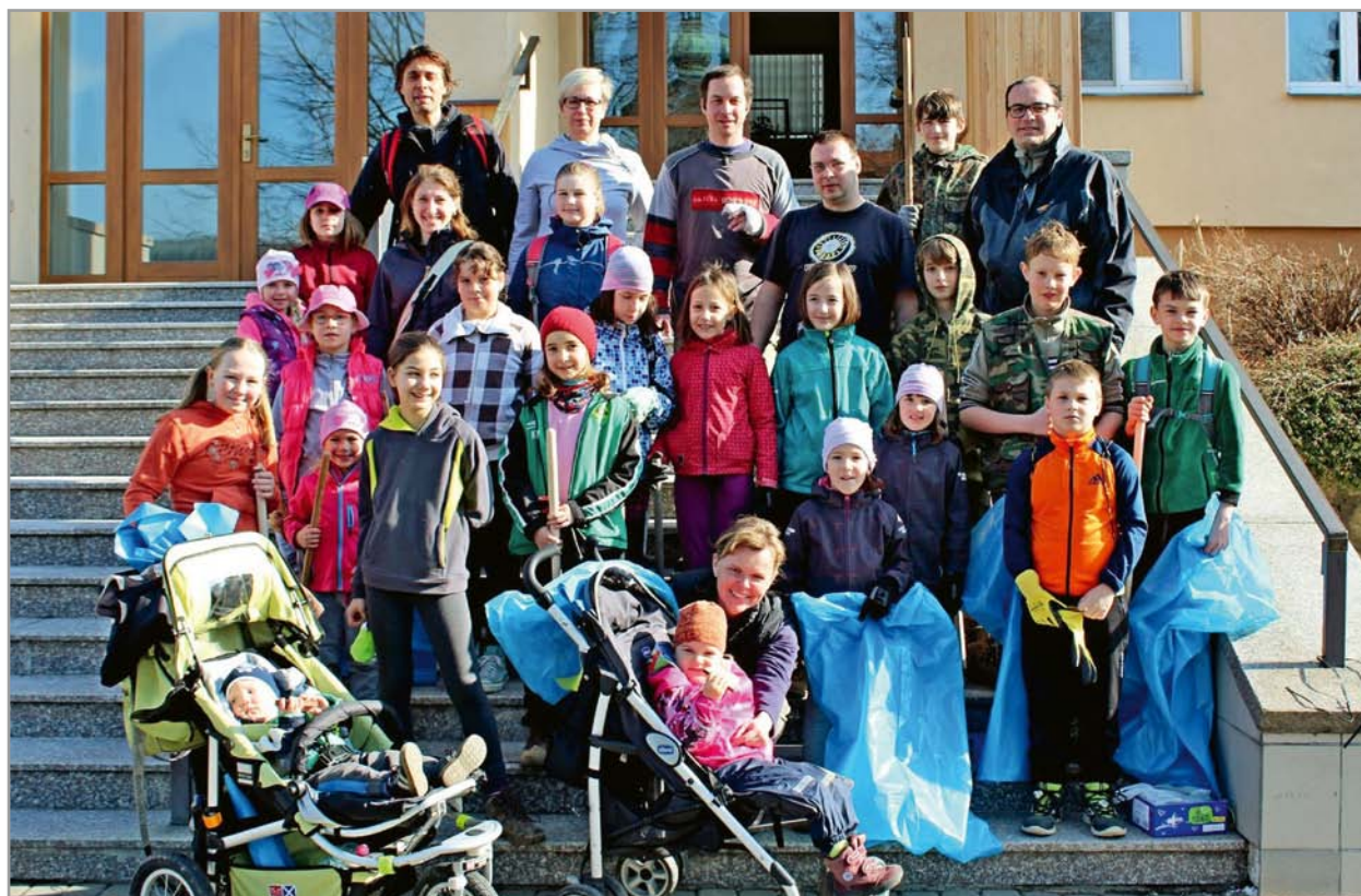
Jarní úklid obce