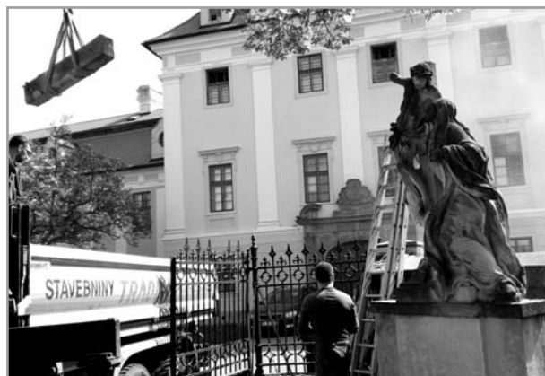
Odvoz sochy k restaurování u vjezdu do dvora gymnázia