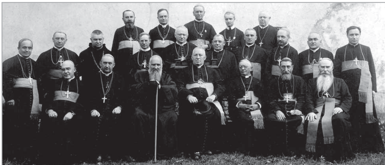
Předsednictvo V. un. kongresu ( muž s hůlkou uprostřed je lvovský metropolita Ondřej Šeptyčkyj ).