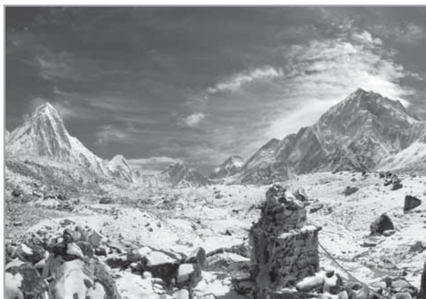
Údolí mezi Pumori a Nuptse