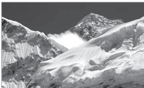
Vrchol Everestu