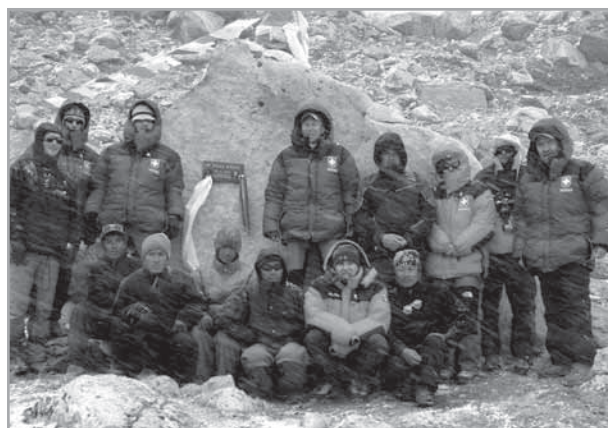
Skupina se Šerpy po připevnění pamětní desky