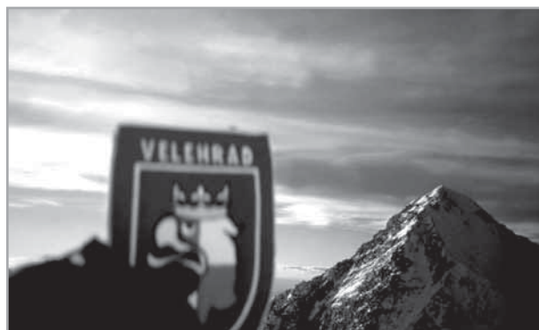
Velehradským praporem - v pozadí vrchol Everestu